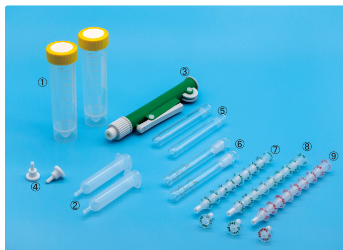
※ 試薬 (⑩⑪⑫) は写真がありませんが、キットに同梱されております。

【お貸出し品】 固相の連結・取外しに便利な「固相カートリッジ脱着器」及び前処理作業に便利な「残留農薬分析用試験管ラック」はお試しキットご購入時にお貸出し可能です。