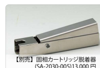
【別売】固相カートリッジ脱着器 (SA-2030-005)13,000 円

固相の連結・取外しに便利な「固相カートリッジ脱着器」及び前処理作業に便利な「残留農薬分析用試験管ラック」はお試しキットご購入時にお貸出し可能です。