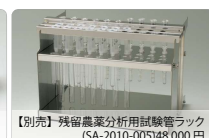
【別売】残留農薬分析用試験管ラック (SA-2010-005)48,000 円