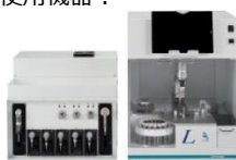
全自動固相抽出装置 ST-L400 (アイステイサイエンス)