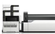
UHPLC(Nexera X2) 及びLCMS-8045 (島津製作所)