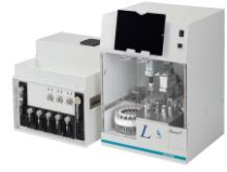
ST-L400 For STQ Method