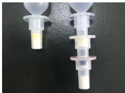
左) C18-50 右) HLBi5-20+GCK-20+PSA-30