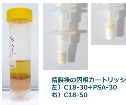
遠心分離後の状態